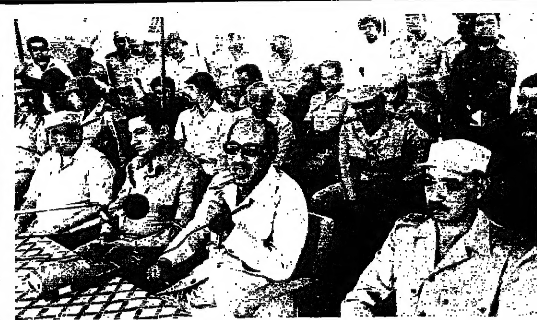
الرئيس السادات يتحدث الى الضباط والجنود المصريين خلال زيارته الى الجبهة الغربية والسيرة الترياق اول ميدان الفلبي الجسسي، والى اليمين نائب الرئيس السيد حسني مبارك

شيك كارتر الرئيس كارتر في راي مسؤول عربي كبير، سحبه شيكا بجوار رصيده بالنسبة الى التسوية في الشرق الاوسط. ولا تترك اسرائيل مرت الشيك. ولا العرب يقبلوا قيمته. ولا سحبه الشيك تراجع في القاهرة. ذلك ان الرئيس كارتر هو اول رئيس امريكي يحدث عن ضرورة اقامة وطن فلسطيني، وعن الانسحاب الاسرائيلي شبه الكامل. يصرف النظر عن التفاصيل وعن الخلافات حولها. وهو لا يستبعد ان يتراجع عن هذا الموقف. ولا ان يصفى هذه الخطة او تلك شيكا صغر حجمته من ان تترك في تصوية جزئية. وليس هناك حكم عربي يستبعد ان يتقل ما وعد به في الشرق الاوسط. او يتقل بما وعد به في الشرق الاوسط. ومن الصعب ان نلتم اسرائيل في الحديث عن السلام من دون ان تعتمد بحرف الشيك الذي سحبه كارتر.